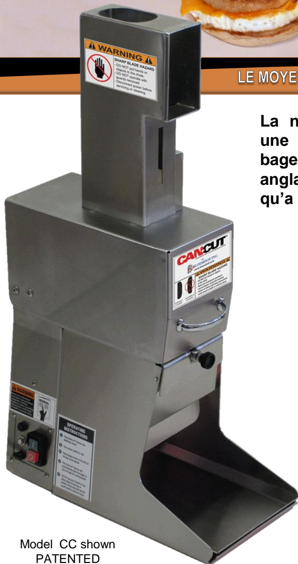
Model CC shown PATENTED

LE MOYEN LE PLUS FACILE POUR TRANCHER LES BAGELS ET PETITS PAINS